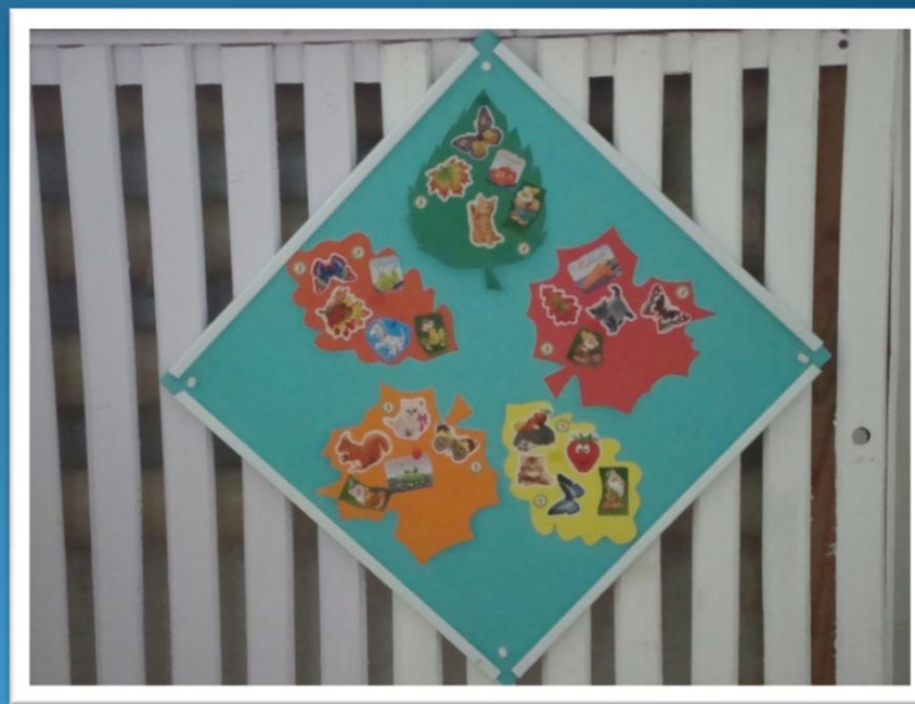
Стимульное панно «Листопад»