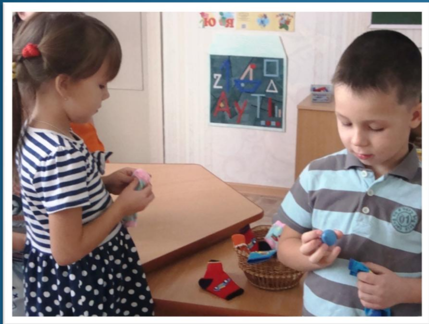
«Корзинка с носочками»