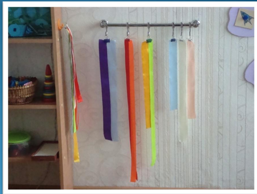
Линейка «Разноцветные ленточки»